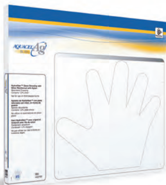
Rękawiczki AQUACEL® Ag BURN