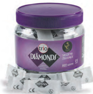
Saszetki żelujące Diamonds™