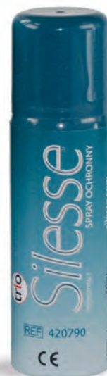
Spray ochronny Silesse™