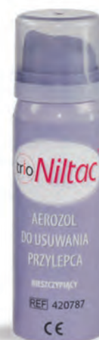
Aerozol do usuwania przylepca Niltac™